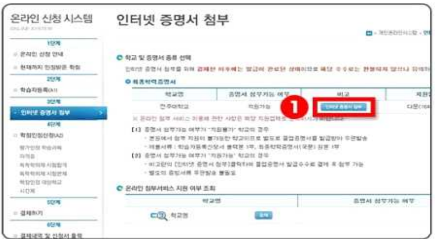
1 인터넷 증명서 첨부 클릭