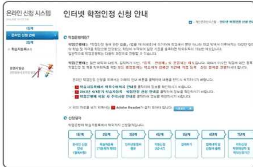
온라인 신청 시스템 접속