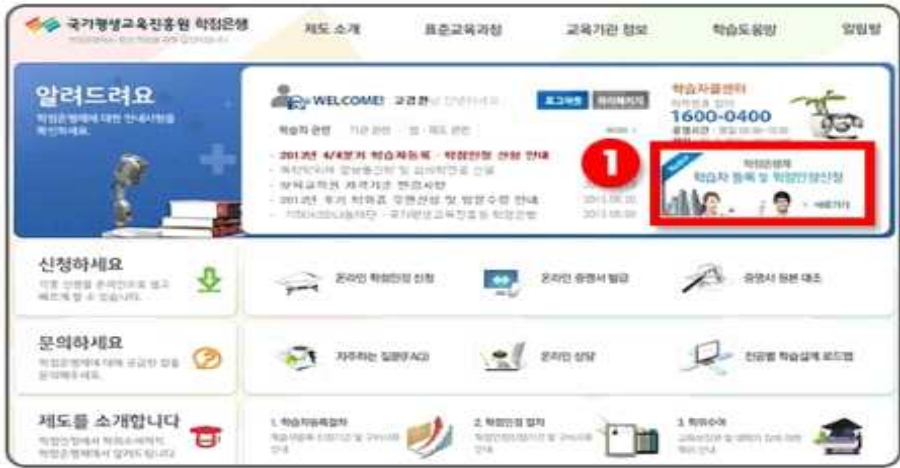
1 로그인 후 <학습자 등록 및 학점인정신청> 클릭