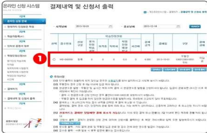
1 학습자 등록 결제 확인