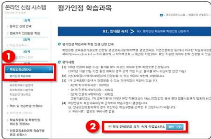
1 안내문 확인 2 체크박스 체크 후 확인